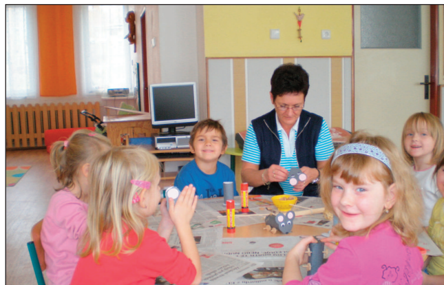
Děti v novém kroužku Tvořivá dílna