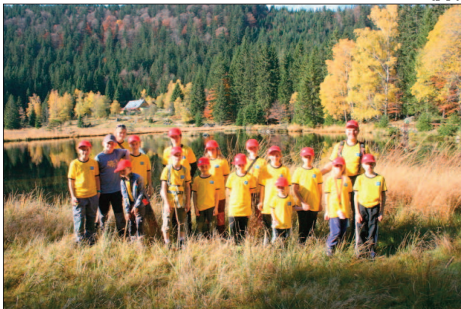
Outdoor kids na prvním soustředění

Zájemci o členství se mohou hlásit na telefonu: 724 830 441, nebo na emailu: mankova@cz-outdoorkids.eu . (pp)