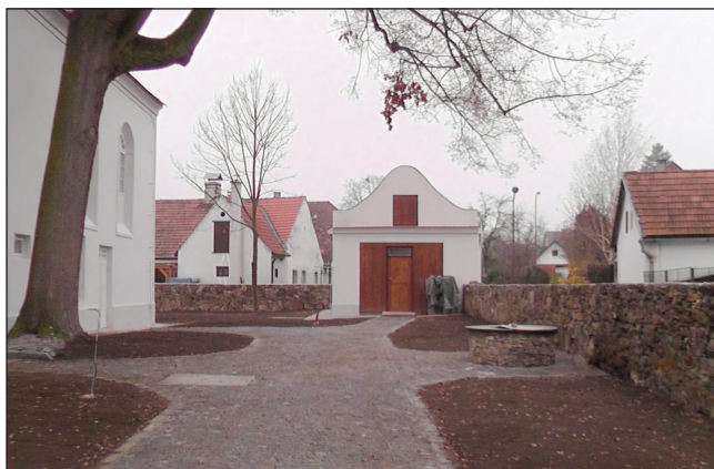
Krásně upravený venkovní prostor před synagogou

První polovina prosince je nejzazší termín, kdy se synagoga znovu otevře veřejnosti. Hlavnímu sálu již dominuje iluzivní oltář v plné kráse; bělost místnosti tlumí tmavá břidlice zbrusu nové podlahy. Kolem vchodu i bočních nik byly odkryty a zrestaurovány nápisy v němčině a hebrejštině. Stejná tmavá břidlice kryje i schody do modlitebny, kde vzniká příčka oddělující prostor určený k modlitbám i intimnímu poslechu či čtení. Zbývající prostory přízemí zpřijemňují krásné původní zrestaurované dveře. Venkovní prostory nabízejí pohled na měkké dřevo vchodu do venkovního objektu a poklopu studny, kámen zídky i studny či dlažbu chodníku a další krásnou práci tentokrát kovářskou – stříšku nad vchodem, a především dvoukřídlou bránu hlavního vstupu do areálu.