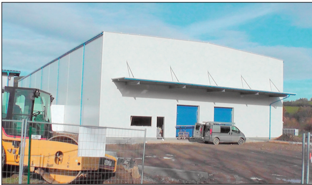
Nový sklad firmy KMP